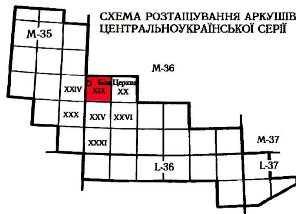
СХЕМА ВИКОРИСТАННЯ МАТЕРІАЛІВ