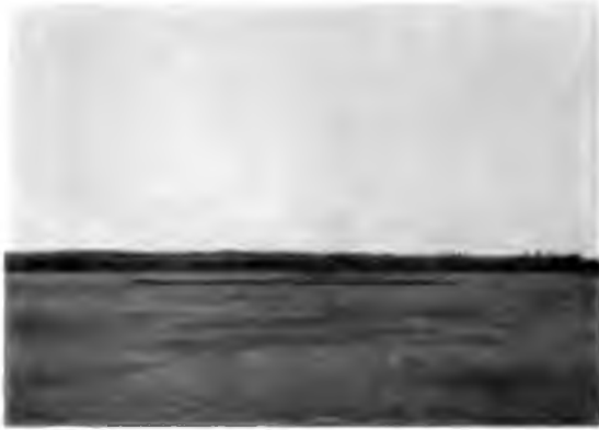
Плоты на Вычегдѣ

наго производства лѣса въ Вологодской губернии 8.100.000 десятинъ, т. е. 77,884 кв. версты — пространство больше, чѣмъ Греція, больше, чѣмъ двѣ Швейцарии.