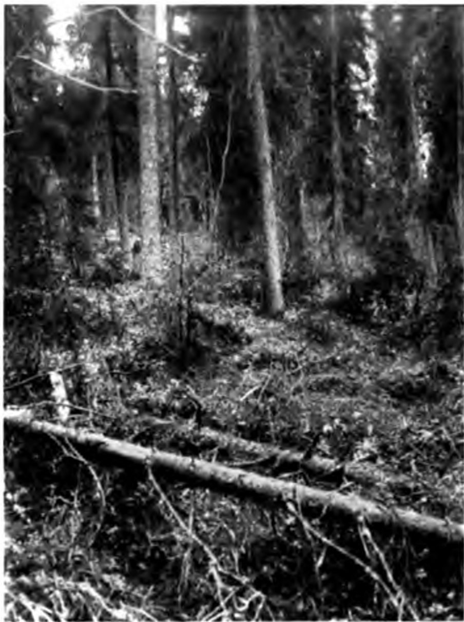
Лѣсъ на берегу Вишеры.