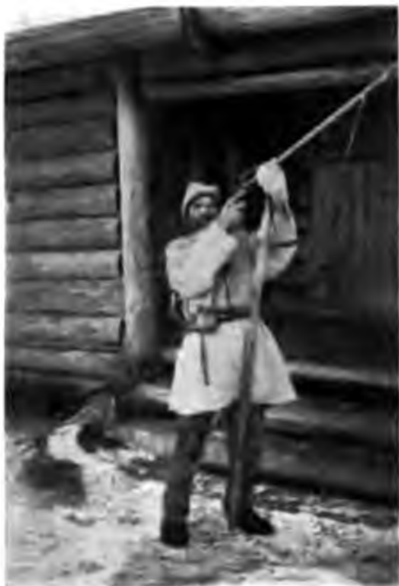
Зырянинъ въ охотничьемъ костюмѣ

Зыряне — народность, о которой первое упоминанне встрѣчается въ XVI вѣкѣ, гдѣ говорится о „Сырьянахъ“, ранѣе же того они не отдѣлялись отъ пермяковъ; происхождення несомнѣнно финскаго, по крайней мѣрѣ типы, встрѣчающіеся между ними, переносятъ смотрящаго на нихъ въ міръ Ибсеновскихъ героевъ и такъ и кажется, что нѣко-