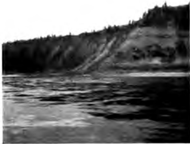
„Опоки“ на Сухонѣ.

Ознакомившись достаточно съ Тотьмой, вечеромъ мы отправляемся далѣе внизъ по Сухонѣ, направляясь къ слѣдующей нашей остановкѣ—Устюгу. Весенней прибылой воды много и уровень ея дѣлаеть рѣку очень полноводной и широкой, такъ что, глядя сейчасъ на нее широкую и глубокую, совершенно не вѣрится, что лѣтомъ тутъ и маленькіе пароходы проходятъ съ большимъ трудомъ, а большіе прямо перестаютъ ходить выше Устюга. Вечеръ тихій, рѣка, несмотря на быстрое течение, гладка какъ зеркало и придвинувшіяся къ самой водѣ еловые лѣса зубчатой стѣной отражаются въ потемнѣвшей ея поверхности.