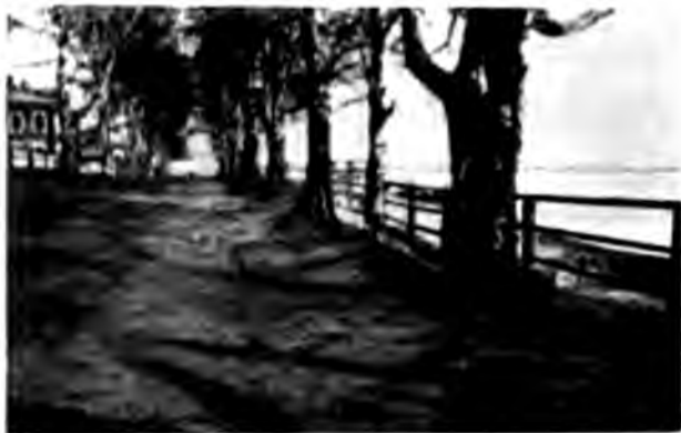
Набережная въ Сольвычегодскѣ

Сольвычегодскъ стоитъ на правомъ берегу Вычегды, маленькии городокъ, въ безпорядкѣ какъ-то разбросанный по песчаному берегу. У самой воды высится окруженный деревьями соборъ, нѣсколько церквей поднимаются надъ небольшими невзрачными домиками города, бульварчикъ протянулся по берегу, а къ самому городу съ трехъ сторонъ подступилъ тощій сосновый лѣсокъ. Въ на-