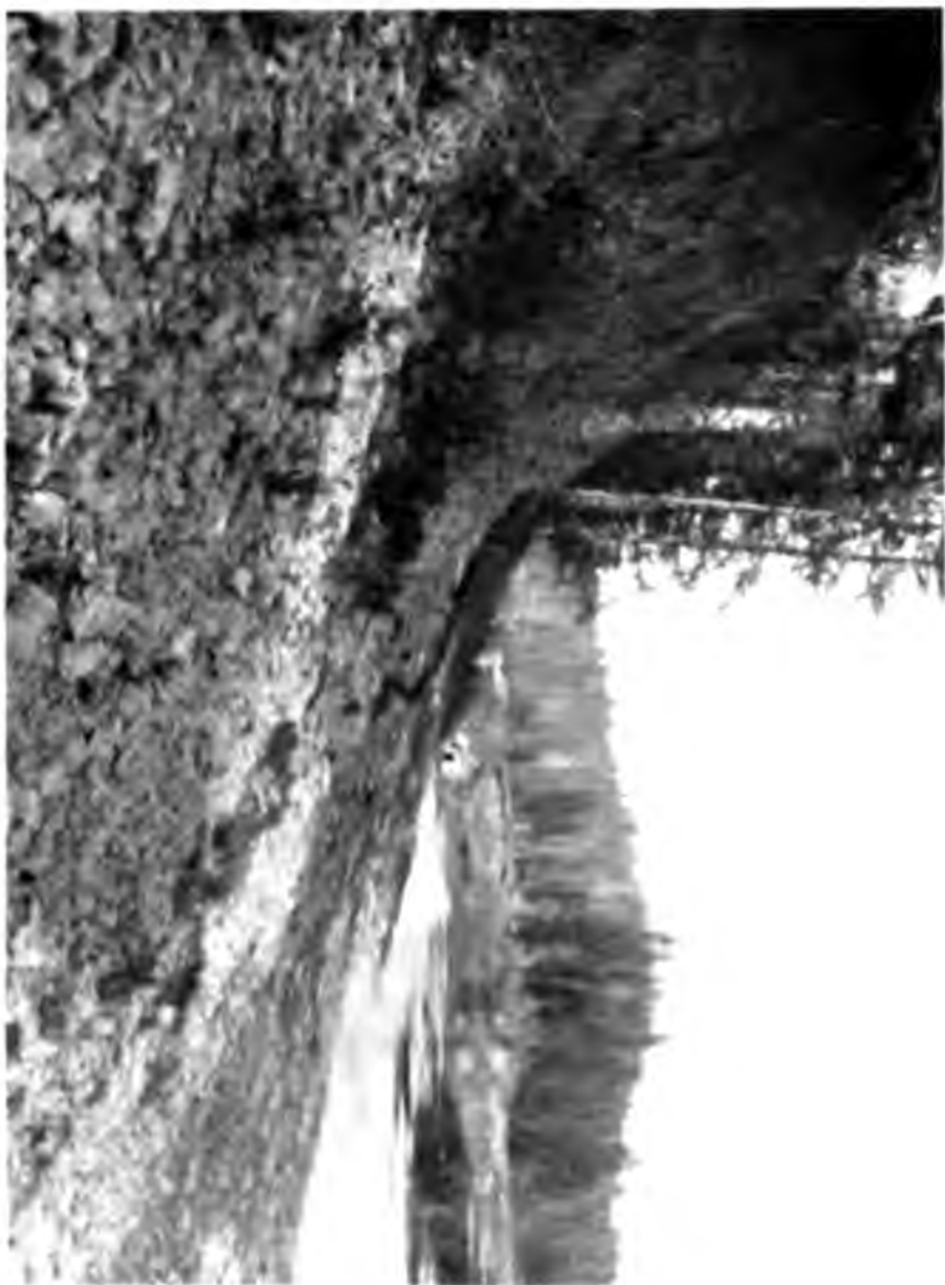
Склад, у подножжя котрого виходять сфери-подорожчє Млнчч