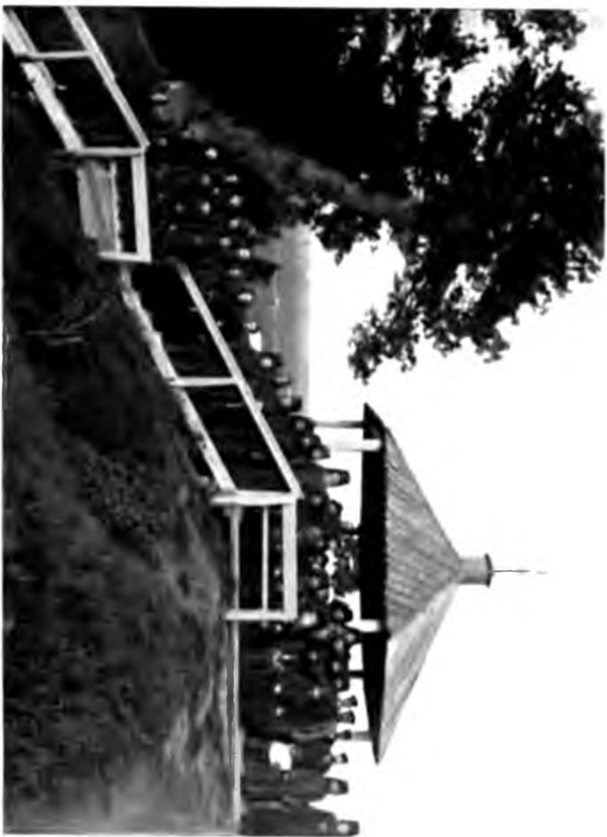
Братя Копачевската манастира