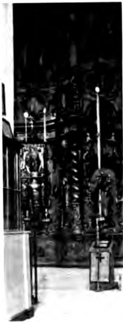
Часть иконостаса въ Гledenскомъ монастырѣ, близъ Устюга

Монастырь самаго обыкновеннаго типа и снаружи ничѣмъ особаго вниманія на себя обратить не можетъ; въ оградѣ все заросло травой, высятся кедръ—остатокъ старины, сваленъ кое-какой хламъ. Жилого вида совершенно нѣтъ. Храмъ внутри довольно интересенъ, особенно своимъ стариннымъ иконостасомъ и нѣкоторыми иконами итальянскаго письма. Когда мы стали внимательнѣе разсматривать входныя двери, оказалось, что онѣ всѣ закрыты толстымъ слоемъ известки, а изъ-подъ нея кое-гдѣ проглядываютъ маюликовые изразцы. Выйдя наружу, мы замѣтили, что и карнизы и наличники оконъ всѣ маюликовые, но также, какъ и двери, всѣ тщательно замазаны известкой и выкрашены подъ одинъ грязновато-желтый колеръ; конечно, стали говорить о томъ, какъ иногда побѣлочка и подкрасочка съ самымъ добрымъ желаниемъ украсить и подчистить, безъ разумѣнія, ведутъ къ результатамъ совершенно противоположнымъ и вещь становится никуда негодной, а монахъ, насъ сопровождавшій, услыжавъ нашъ разговоръ и упоминаніе о побѣлочкахъ и подкрасочкахъ, безъ всякой ироніи, видимо отъ чистаго сердца, съ серьезнѣйшимъ видомъ сказалъ: „да, отецъ Иннокентіи много потрудился къ украшенію обители, да вотъ уже кое-гдѣ и пообвалилась штукатурочка, а прежде весьма красиво было“. Дѣйствительно, имя отца