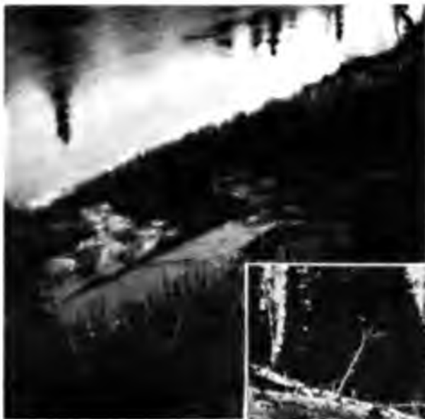
Выходъ нефти на Ухтѣ.

мень. Нефть сочится черезъ пробку, на которой отъ внутренняго давления все время вздуваются черные пузыри; просачивающаяся нефть стекаетъ по трубѣ, отчего та и блеститъ такъ на солнцѣ, и образуетъ около нея лужу, изъ которой прососала ходъ