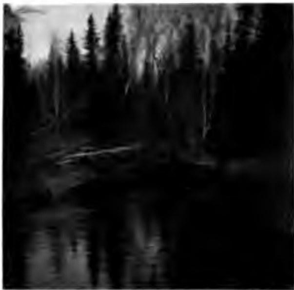
Р Джюнъ-юль (Половинъ-юль).

малыхъ усилий пробираться къ ней въ нѣсколькихъ мѣстахъ черезъ этотъ ломъ, а большею частью мы были принуждены, слѣдуя ея течению, идти порядочно отступивъ отъ нея, но и въ этихъ немногихъ мѣстахъ, гдѣ возможно было подойти къ самой водѣ, мы наткнулись въ одномъ мѣстѣ на капли нефти, поднимающіяся со дна, а въ другомъ на выступающую нефть на песчаномъ сыромъ берегу; мы ее пробовали смывать, и черезъ нѣсколько минутъ малень-