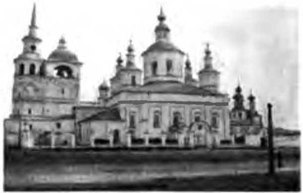
Соборъ въ Устюгѣ.

пожертвованный еще Строгановыми образъ преподобнаго Прокопія, вышитый на платѣ удивительно тонко и искусно шелками, канителью и жемчугомъ. Въ общемъ соборъ не даетъ впечатлѣнія особой старины, есть нѣсколько старинныхъ иконъ, но того чувства, какое испытываетъ человѣкъ, зашедшій въ московскіе кремлевскіе соборы или въ Сольвычегодскій, гдѣ все имѣетъ свою исторію и на всемъ лежитъ