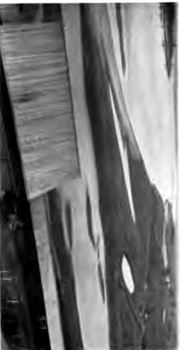
Видъ на Вичегду съ коломанни Коромежската манастира