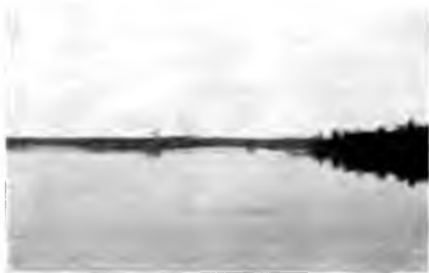
С. Весляны на Вымѣ.

Также тихо, тепло и пасмурно было и на утро, когда мы подъѣзжали къ с. Весляны. Берега здѣсь уже пошли невысокіе, сплошь заросшіе лѣсомъ, пустынные, а до лѣса неширокая полоса покоса. Весляны стоятъ на лѣвомъ берегу Выма, при впа-