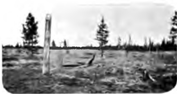
Стяжной столбъ на р. Ухтѣ.