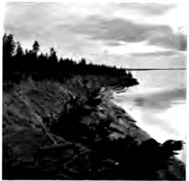
Берегъ Вычегды въ 30 в. отъ Яренска.

Около Яренска берега Вычегды песчаные и низкіе; по нимъ идутъ все время луга съ наполненными водой низинками и кустарниками; пасутся выпущенныя уже на подножный кормъ лошади, хотя взять въ лугахъ совершенно нечего—они еще совершенно желтые безъ всякаго намека на зелень, только въ низинахъ изъ стоящей воды показываются широкіе ярко-зеленые листья калужницы болотной; лошади маленькія, приземистыя, но очень плотныя и, какъ