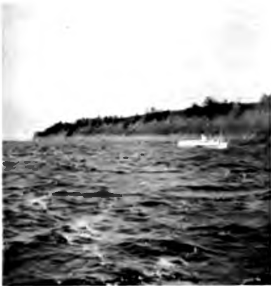
Лаина между Устиновомъ и Котласомъ.