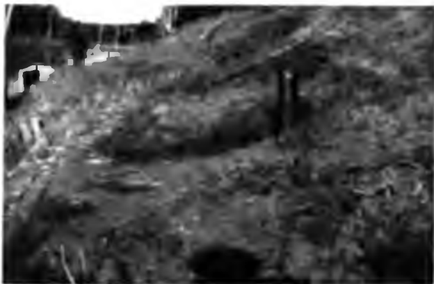
Выходъ нефти на р. Ухтѣ.

ихъ лиловомъ фонѣ пятнами вкраплена темная зелень елей, а версть за 10 до завода идутъ громадныя сплошныя гари, раскинувшіяся на нѣсколько версть по рѣкѣ то по одному берегу, то по другому, и неизвѣстно насколько вглубь отъ рѣки, по крайней мѣрѣ, насколько глазъ хватаетъ, все идутъ онѣ; вѣроятно, такой лѣсной пожаръ представляетъ грандіозную картину, стоитъ только представить себѣ, какъ громадное пламя съ трескомъ и воемъ, клубясь и рассыпая искры, перебрасывалось черезъ рѣку съ берега на берегъ.