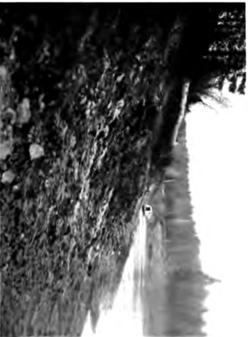
Схро-водородные источники на Вымь.