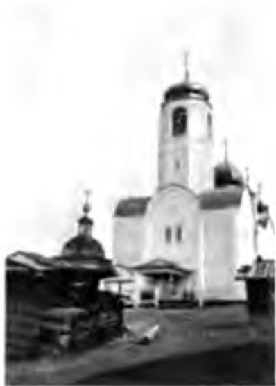
Церковь въ Веслянахъ.

Всѣ жители, которыхъ мы спрашивали объ экономическомъ положеніи, въ одинъ голосъ говорятъ, что урожаи тутъ очень плохи, самый лучшій при благоприятныхъ обстоятельствахъ бываетъ самъ 5, а частенько не собираютъ сѣмянъ, губить всходы морозъ; это, вѣроятно, объясняется тѣмъ, что болота и лѣсъ подступили къ самымъ полямъ. Около домовъ сѣютъ коноплю, для собственнаго употребленія, не съ промысловой цѣлью, сѣютъ и ленъ также только для себя; для него выбираютъ по берегамъ увалы, куда не хватаетъ сѣверный вѣтеръ, такія распашки и видны на противоположномъ берегу. Покосы имѣютъ по рѣкамъ и рѣчкамъ, но такъ какъ полоса ихъ очень узка, то косятъ даже далѣе 200 верстъ отъ села. Конечно, своего хлѣба не хватаетъ и живутъ покупнымъ, а средства къ жизни добываютъ охотой, рыболовствомъ и работой на лѣсныхъ заготовкахъ. Вымъ рѣка рыбная и вымская семга славится не хуже печорской.