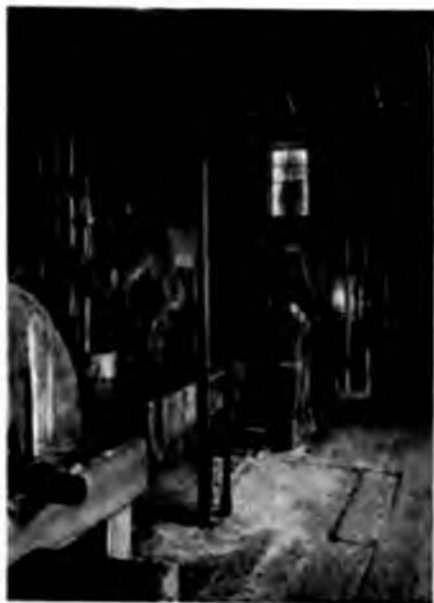
Внутренность вышки. Буреніе.

Построена вышка, въ которой собственно и производится буреніе,