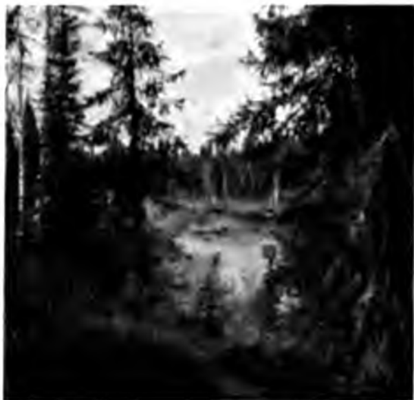
Шема Вуква въ еловомъ лѣсу

растутъ деревья. Видны старыя остожья,—оказывается, что и отсюда сплавляютъ сѣно въ деревни по Выму, а это составляетъ версть 140; какъ значитъ, велика нужда въ сѣнѣ и какъ мало тамъ расчищенныхъ мѣстъ, если и отсюда зыряне выцарапываютъ сколько могутъ травы и на утлыхъ плотикахъ везутъ ее домой за 140 версть, а какъ говорятъ, иногда и довезутъ - то ее только до пороговъ, а тамъ при неудачѣ и плотикъ налетитъ на камни и разлетится на свои состав-