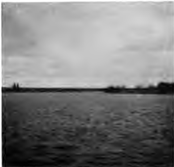
Впаденіе Нившеры въ Вишеру

Такимъ образомъ доходимъ до села Богородскаго, не доѣзжая котораго съ версту, въ Вишеру впадаетъ Нившера; Богородское очень большое село съ приземистыми, въ безпорядкѣ разбросанными многочисленными домами, длинными улицами и закоулками между ними, съ земскою почтой и волостнымъ правленіемъ. Тутъ была устроена тор-