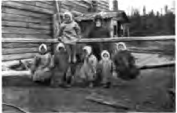
Зырянскіи дѣдъ съ внучатлами

Служать они лѣсниками такихъ обходовъ, что, пожалуй, и ходить - то въ нихъ не стоитъ, все равно не обойдешь; это тутъ-то лѣсникъ докладывалъ И. М. Шемигонову съ самымъ равнодушнымъ видомъ, что у него въ обходѣ 278 тысячъ десятинъ 700 квадр. сажень; вѣроятно, и въ голову ему никогда не приходило, что