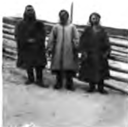
Самоѣдъ и зыряне. **