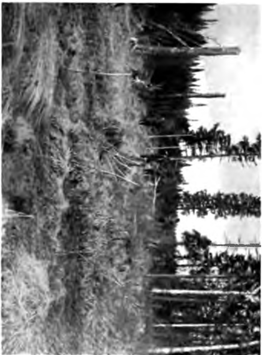
Болота на Кеперань р. Виллепу