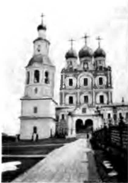
Храмъ Введенскаго монастыря въ Сольвычегодскѣ.

ской и женский; на днѣ ихъ еще и сейчасъ, покопавъ песокъ, можно найти кости погибшихъ узниковъ. Все это въ такихъ толстыхъ стѣнахъ, послѣ столькихъ запутанныхъ проходовъ, что никакой звукъ ни оттуда, ни туда проникнуть не можетъ, и жутко тамъ и сейчасъ бродить со свѣчей, каково же было тѣмъ, которыхъ опускали въ эти колодцы въ абсолютный мракъ, тишину и безъ всякой надежды выйти оттуда! Тяжелое впечатлѣние производятъ эти подземелья, когда въ ихъ сырость и мракъ съ зажженною свѣчею уходишь съ яркаго солнечнаго свѣта. Сейчасъ тамъ лежитъ всякій хламъ и нельзя сказать, чтобы и тамъ не было цѣнной старины, по крайней мѣрѣ мы кое-что замѣтили и интереснаго. Вѣроятно,