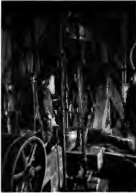
Внутренность вышки Дистанция инструментовъ

долото это, прикрѣпленное къ 28-пудовой тяжести, соединено со штангой помощью особаго приспособления такимъ образомъ, что штанга при опускании внизъ захватываетъ его, приподнимаетъ вверхъ и, когда положение штанги будетъ наивысшее, долото со всею тяжестью срывается и падаетъ внизъ, производя страшный ударъ въ землю. Такимъ образомъ получается, что глухой ударъ слышенъ изъ глубины земли какъ разъ въ то время, когда часть коромысла, къ которой прикрѣплена штанга, и слѣдовательно долото, находится въ наивысшемъ положеніи;