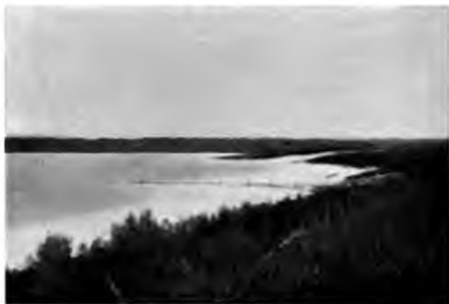
Себентьевское озеро около г. Яренска

глубоко, примѣрно лошади по колѣно; и вправо и влѣво проливъ этотъ только расширяется и нигдѣ не видно спасительнаго обхода. Конечно, на лошади попасть на другую сторону не хитро и на лодкѣ можно, но интересно было бы знать, какъ поступаютъ пѣшеходы. Пристань соединена съ городомъ телефономъ.