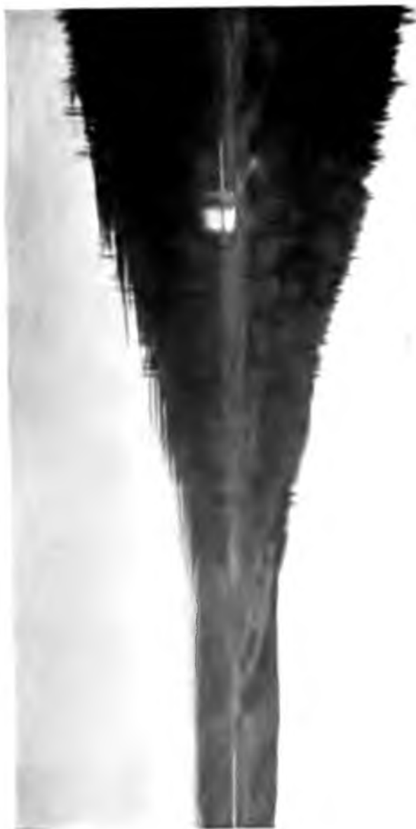
# БУВАЊ ОНОГО СЕПТЕМА