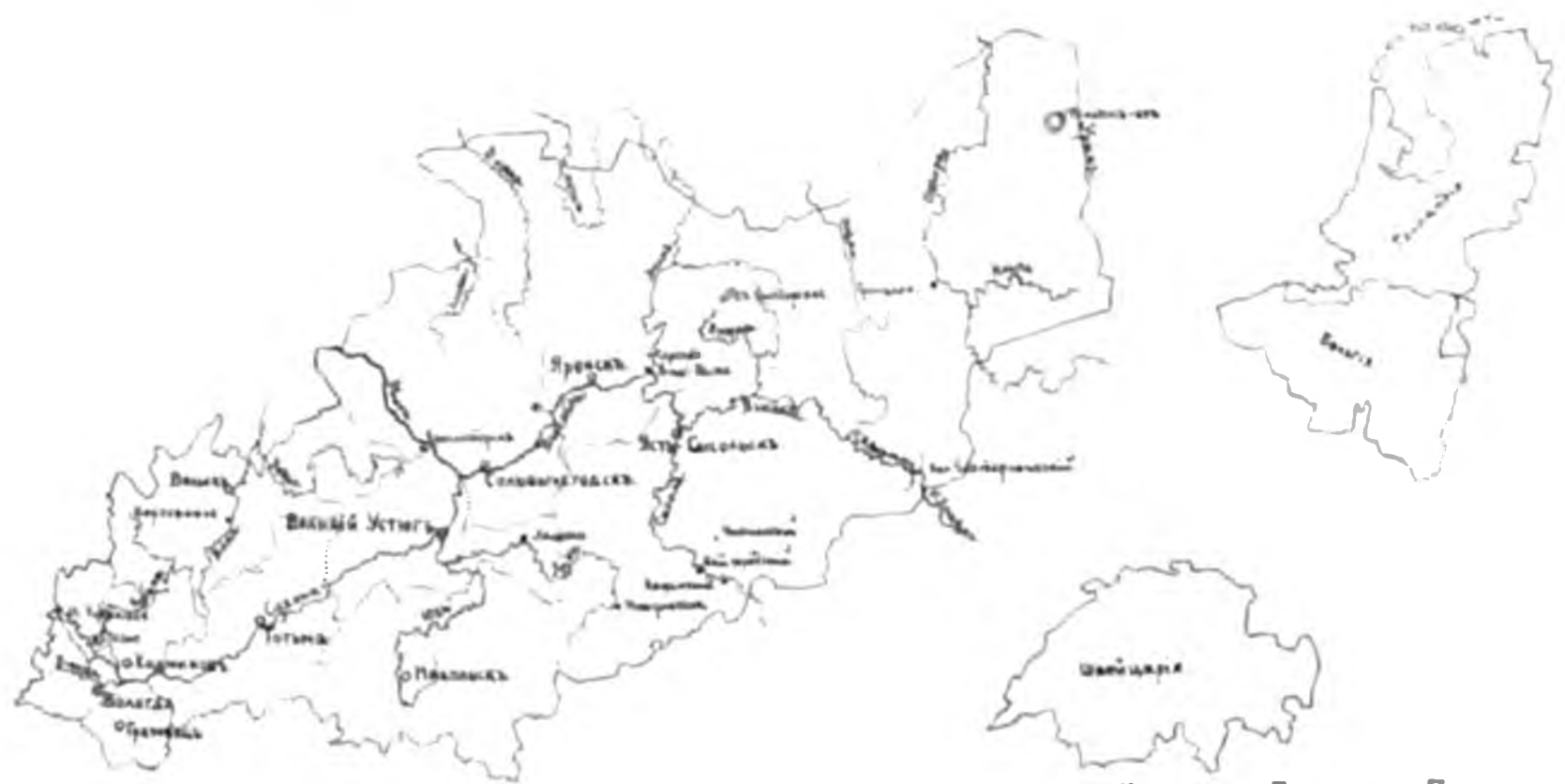
Швейцарія Бельгія и Голландія въ томъ же масштабѣ