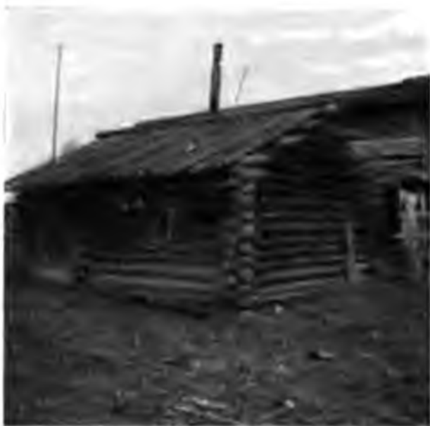
Моделъня на перевалѣ

по стѣнамъ нѣскольکو иконъ, а передъ ними висятъ подсвѣчники съ толстыми свѣчами по срединѣ и мелкими по бокамъ, нѣчто въ родѣ иконостаса. Здѣсь, откуда до ближайшей церкви зимой 120 верстъ, а лѣтомъ и всѣ 150, потребность имѣть свое мѣсто, гдѣ бы можно было помолиться, выразилась въ устройствѣ такой мо- лельни, но мы и вездѣ наблюдали въ деревняхъ зырянъ склонность непре- мѣнно заводить свои де- ревенскія мѣста для мо- литвы, т. е. часовни, даже въ такихъ деревняхъ, у которыхъ подъ бокомъ село. Вообще надо ска- зать, что зыряне, по этимъ внѣшнимъ признакамъ, народъ очень религіоз- ный; не только во всякой деревнѣ можно встрѣтить часовню, но почти у каж- дой керки, у каждого мѣ- ста, гдѣ принято остана-