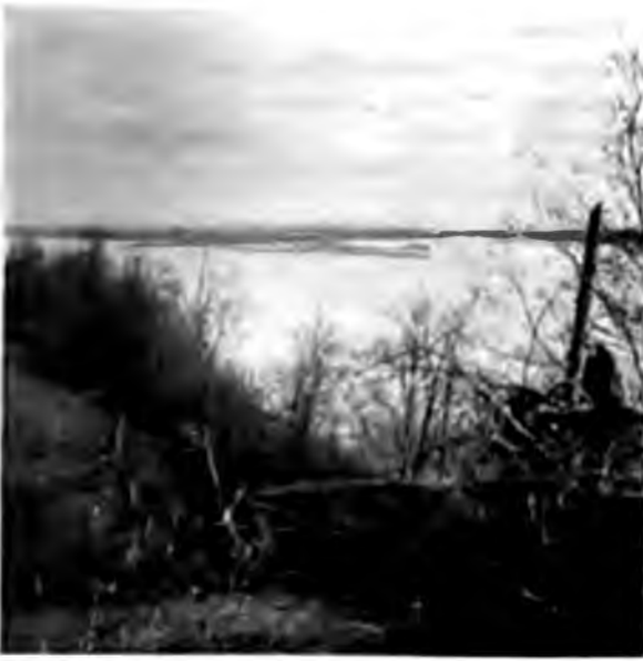
На р. Вычегдѣ.

Вычегды, всё проекты приведения его въ удобную гавань уже сдѣланы и теперь дѣло только зависитъ отъ рѣшенія земскихъ собранія, а значеніе его при возможномъ развитіи Ухтинскаго нефтянаго дѣла дѣйствительно очень большое, такъ какъ на Вычегдѣ другихъ удобныхъ мѣстъ подъ стоянку судовъ не имѣется, по крайней мѣрѣ на томъ протяженіи ея, гдѣ они были бы на удобныхъ разстояніяхъ отъ мѣста будущаго притока на нее нефти. При рѣшеніи общаго вопроса