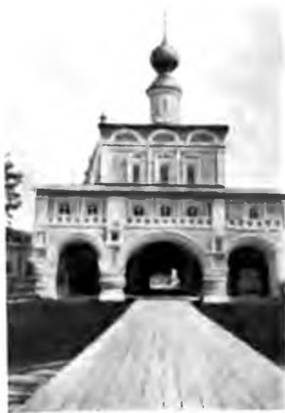
Крыльцо въ мужскомъ монастырѣ въ Устюгѣ.

Имѣется въ городѣ и недурной общественный садъ, непремѣнная принадлежность всякаго города, въ иныхъ составляющіи гордость горожанъ, въ иныхъ въ видѣ загаженнаго скотскаго выгона. Въ Устюгѣ садъ тѣнистый и густой, но, кажется, не въ достаточной мѣрѣ заботливо содержимый. Набережная, какъ я уже говорилъ, вся покрыта двойнымъ слоємъ бревень, въ защиту отъ весенняго льда и подмыва. Несмотря на то, что сегодня 6-ое мая, массы льда, нагроможденныя