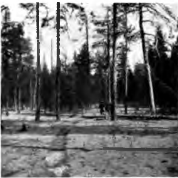
Лѣсъ заросших бѣлками и ельнички

покоѣ и долго еще только звѣрь да птица будутъ оживлять эту пустыню.