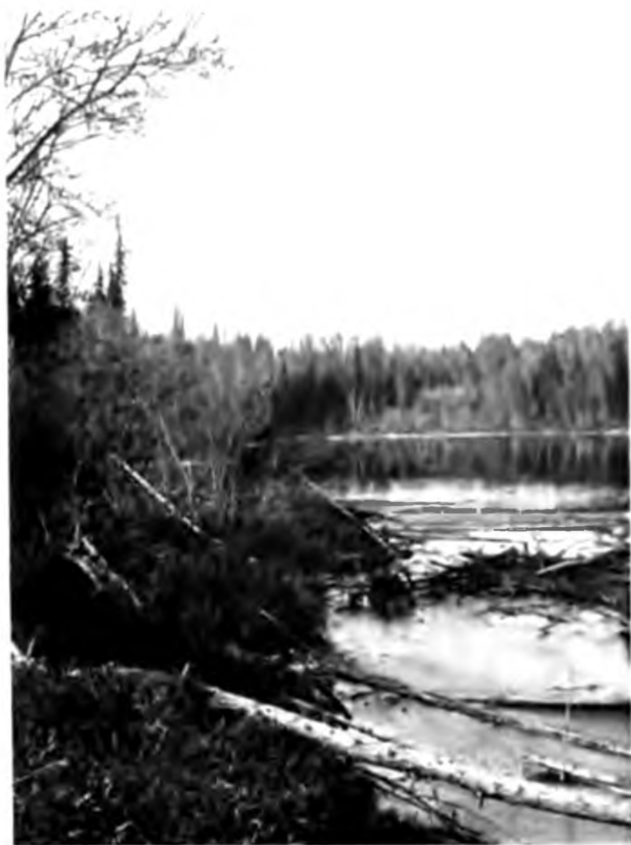
Железистое озеро около сероводородных источников