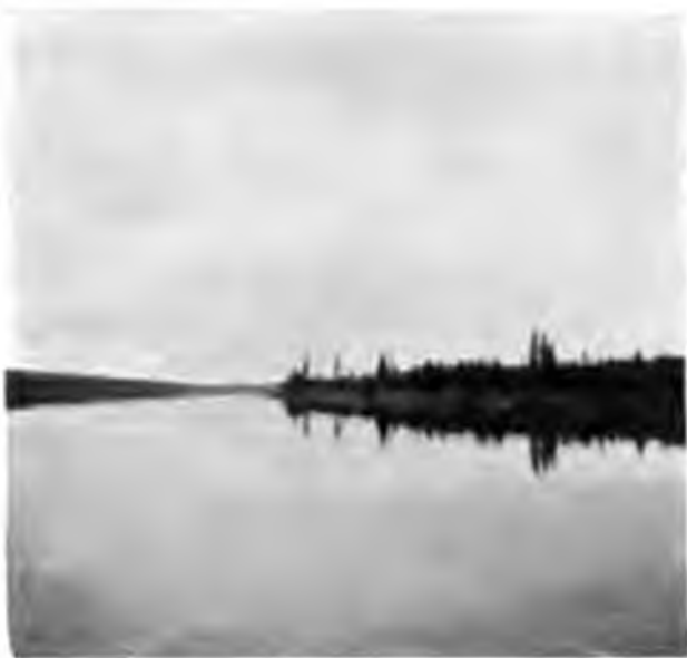
Вымѣ въ 135 в отъ устья.

вия. Названия селъ „Ляли“ и „Кошки“ также связываются преданіемъ съ дѣятельностью въ этомъ краѣ Св. Стефана; рассказываютъ, что онъ, когда шелъ здѣсь съ своею проповѣдью, пришелъ въ село, теперешнее „Ляли“, и засталъ здѣсь весь народъ по случаю какого-то праздника пляшущимъ и припѣвающимъ „ляли, ляли“. Проповѣдь его они, занятые пляской и пѣніемъ, слушать не стали и тогда Стефанъ, будто бы, сказалъ: „Такъ будьте же вы отнынѣ на