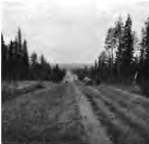
Дорога отъ Серегова въ Кылтовскіи монастырь.

тельно, вся эта полоса дороги представляет из себя уже не мшистый покров заболоченнаго лѣса, а заросшее травой пространство безъ всякихъ признаковъ мха. По мѣрѣ удаленія отъ Выма дорога все поднимается и наконецъ съ высшей точки ея открывается чудный видъ на безконечные лѣса по долинѣ Выма, сливающейся въ голубой дали съ долиною Вычегды. На 14-ти верстахъ дорога не одинъ разъ поднимается на горы, не въ одномъ мѣстѣ опускается внизъ и перебѣгаетъ по прекрасно устроеннымъ мостамъ рѣчки и болота; въ одномъ мѣстѣ она идетъ мостомъ саженъ 150, пересѣкая очень обширное и очень мокрое болото съ большими лыдинами, зарослями осоки и тощей березы.