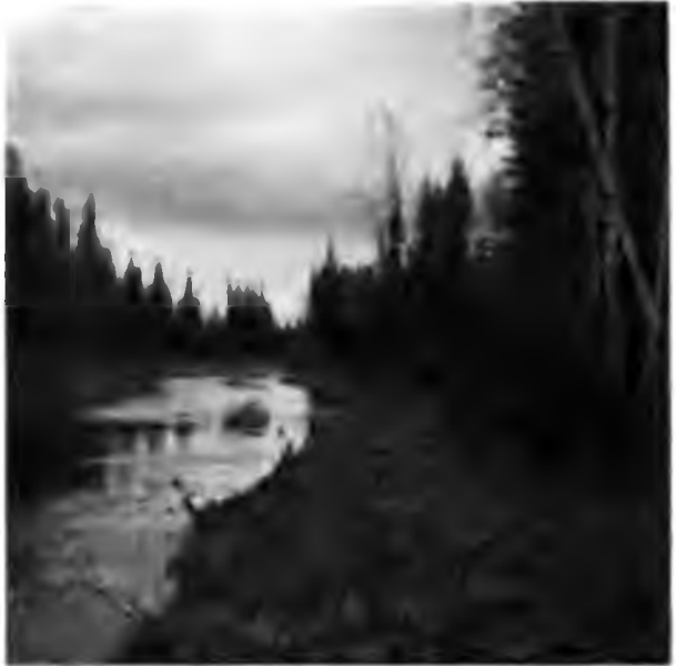
Вуква въ 30 в. отъ устья.

ды кустики тальника и ивы. Верстахъ въ 25 отъ устья, Вуква входитъ въ страшно глухой еловый лѣсъ, который уже не даетъ здѣсь мѣста никакимъ покосамъ, никакимъ полянкамъ, подступилъ съ обоихъ довольно высокихъ береговъ и смотрится въ рѣку; въ мрачную глубину его впереди уходитъ рѣка. Здѣсь въ Вукву впадаетъ такая же мрачная рѣчка Той-ю. Съ береговъ кое-гдѣ съ журчаніемъ падаютъ въ Вукву ручейки (по-зырянски шоры).