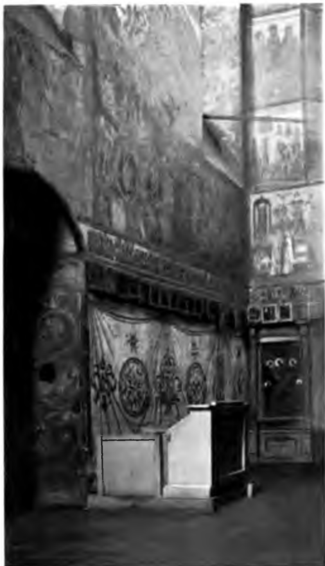
Уголь Сольвычегодского собора.