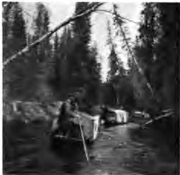
Нашъ караванъ на р Вукъ-вѣ.

Живой жизни все-таки мало: изрѣдка пролетитъ куличекъ, пропорхаетъ бабочка, да быстрыми, отрывистыми движеніями пробѣжитъ по прибрежному песку ящерица;