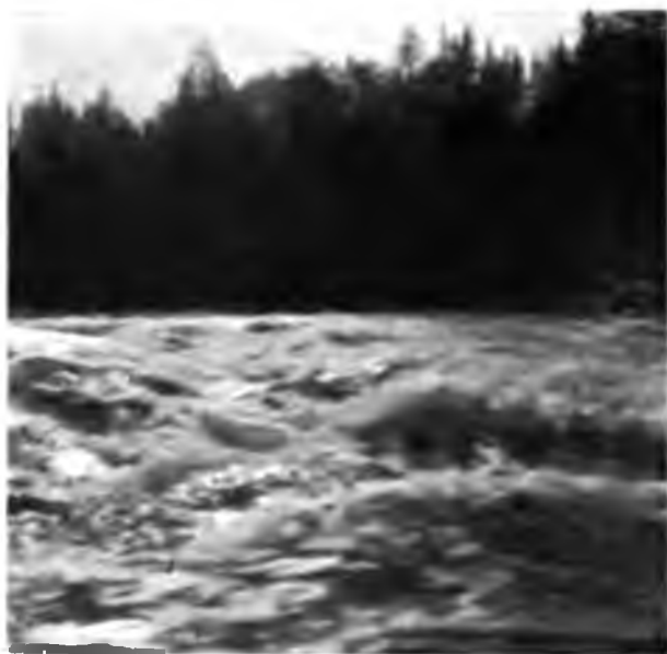
Порогъ на Ухтѣ

Верстахъ въ 8 отъ поселка на Ухтѣ порогъ „Омуль-юла-косъ“, гораздо поменьше Вымскихъ, да и ѣдемъ мы по теченію, такъ что не успѣетъ лодка въѣхать въ пѣнящуюся поверхность рѣчки, какъ страшно быстрое теченіе въ одинъ моментъ выноситъ ее на гладкую поверхность спокойнаго