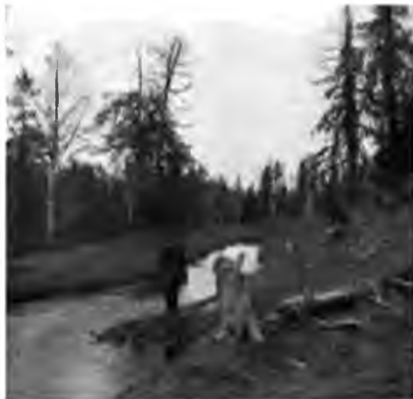
Шомъ Вуква въ 90 в отъ устья.

На восьмомъ чѣмкаѣ мы прошли тропой на перерѣзъ рѣки версты 4, на лодкахъ же, выдѣлывая всѣ крюки, какъ изворачивается Вуква, надо тутъ ѣхать версть 16. Тропа идетъ то по боровымъ мѣстамъ, заросшимъ ягелемъ, то перебѣгаетъ черезъ болота; ломъ въ лѣсу страшный, вѣковой; вѣдь никто никогда тутъ не только не подумалъ убрать что-нибудь, но даже, вѣроятно, и не взглянулъ на эти поваленные огромные стволы, вошедшие въ землю и уже заросшие мохомъ, — въ особенности ломъ этотъ ужасенъ на болотахъ, которыя уже и сами по себѣ достаточно неудобопроходимы, благодаря страшнымъ кочкамъ, а тутъ еще сверху нихъ навалены старые гнилые стволы съ остатками сучьевъ, на нихъ упали слѣдующие и образуется просто невозможное сплетение