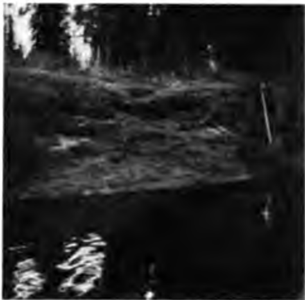
Выходъ нефти на Ухтѣ.

нимается на ея поверхность. Эта первая увидѣнная нами нефть обрадовала насъ ужасно, какъ будто мы и не надѣялись на самомъ дѣлѣ ее увидѣть; мы такъ много о ней слышали, читали, говорили, конечно были убѣждены въ ея существовании, но все-таки увидѣть ее собственными глазами было для насъ весьма интересно и какъ-будто теперь мы уже безъ всякихъ сомнѣній увѣрились въ ея существовании. Потомъ мы столько ее видѣли, что стали относиться ко вся-