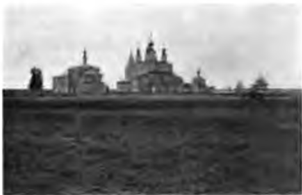
Троицко-Гледенскій монастырь, близъ Устюга.

простого полотна, и даже грубыхъ тканей; всѣ эти произведения продаются въ Устюгѣ въ фабричномъ магазинѣ, но ихъ столько идетъ въ столицы, что тутъ часто выборъ далеко не представляетъ собою образчиковъ всего того, что выдѣлывается на фабрикѣ.