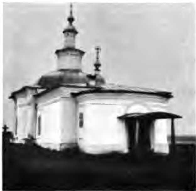
Церковь въ Усть-Вымѣ на мѣстѣ вѣщей березы.