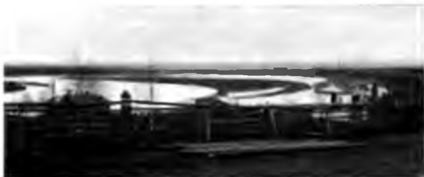
Видъ на Сысолу изъ Усть-Сысольска.