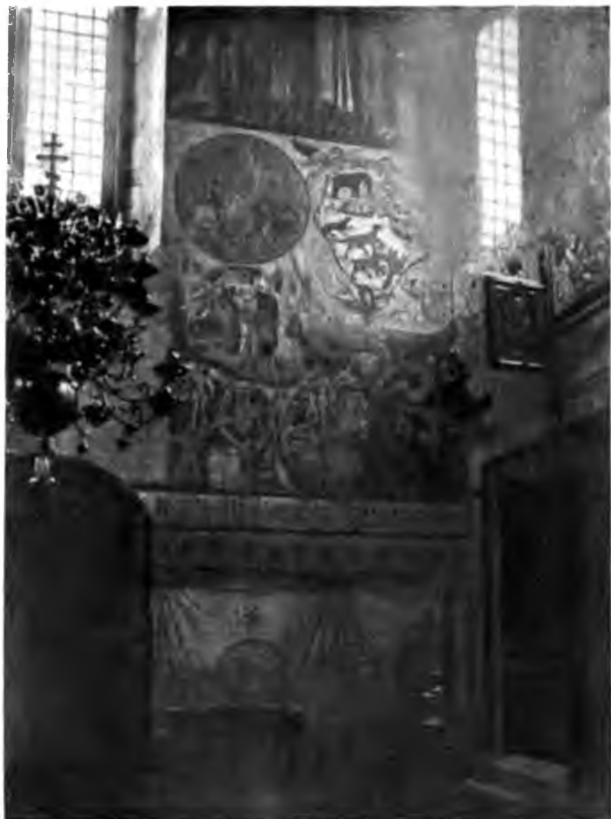
Задняя стѣна Сольвычегодскаго собора.