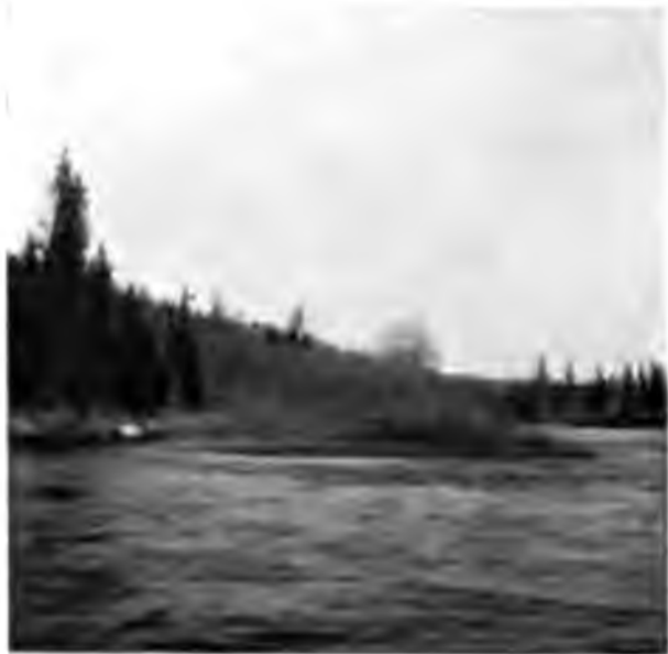
Ухта въ 25 в. отъ завода

гами и очень высокими горами. Версть за 25 до завода порогъ съ страннымъ названіемъ „Лапша-косъ“, перегораживающій всю рѣку отъ острова у праваго ея берега до лѣваго, и пробѣгать приходится за этимъ островомъ по узкому проходу, по которому вода прямо несется и лодку проноситъ съ такою скоростью, что не успѣешь мигнуть, какъ уже островъ остался назади. Кое-гдѣ въ Ухту впадаютъ небольшія рѣчки и тутъ горы какъ будто чуть раздвигаются и образуютъ