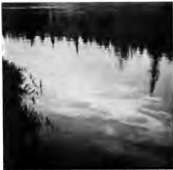
Нефть, плывущая по Ухтѣ.

Недалеко отъ Сидоровской избы правый берегъ Ухты сильно подмытъ и на обрывѣ, образованномъ этимъ подмывомъ, ясно видны слои отложения, которыя мы, конечно, отправились посмотреть. Внизу обрыва, подъ слоемъ песка выхо-