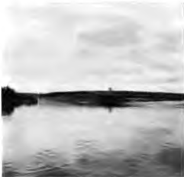
Рѣка и деревня Юль-ва.

Едва мы отѣхали отъ мѣста разставанія съ пароходомъ и со всѣми остающимися на немъ, напутствующими насъ, отправляющихся въ утлыхъ лодочкахъ въ такое далекое и казавшееся въ то время