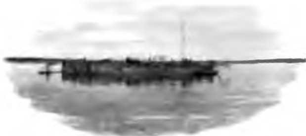
Бары на Вычегдѣ съ чугунами изъ Кажемскаго завода.

чается нѣсколько деревень довольно близко одна отъ другой, то онѣ носятъ одно названіе съ прибавленіемъ верхній, средній и нижній, или по-зырянски: „кыфтыть“ или „катыть“, но собственно это является, конечно, одной деревней.