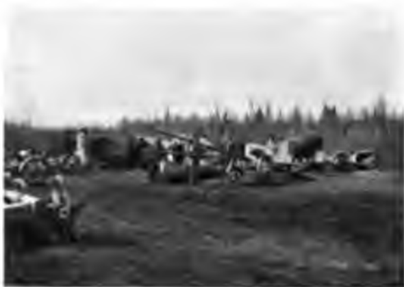
Перевозка лодокъ на перевалокъ

Насъ уже ждали, такъ какъ пришедшие еще вчера члены нашей экскурси распорядились, чтобы все по возможности было готово къ скорѣйшей переправѣ нашихъ лодокъ черезъ это шестиверстное пространство; на берегу уже были приведены лошади, запряженные въ особаго устройства длинные экипажи, приспособленные именно къ перевозкѣ лодокъ, часть которыхъ разгружаютъ и вещи отправляютъ на отдѣльной подводѣ. Мы всѣ отправляемся пѣшкомъ и не раскаиваемся, такъ какъ дорога превосходная, идетъ гористымъ сухимъ мѣстомъ, покрытымъ лѣсомъ опять же съ бѣлымъ мохомъ,