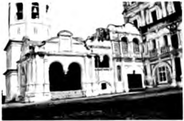
Крыльцо пр. Иверскаго монастыря въ Сольвычегодскѣ

ковъ своихъ. Въ церкви обращаетъ на себя внимание очень старинная икона Введения Пресвятой Богородицы и нѣсколько иконъ въ иконостасѣ, но зато снаружи этотъ храмъ дѣйствительно производитъ впечатлѣніе великолѣпнаго образчика стариннаго русскаго церковнаго стиля. Вѣроятно, мотивы его украшеній не разъ вдохновляли со-