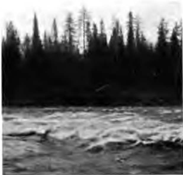
Порогъ „Рочь-косъ“ на Вымѣ.

За этими порогами идутъ еще: малый Рочь-косъ, Ышъ - мысъ - косъ (быкъ - корова - порогъ, названный такъ, вѣроятно, вслѣдствие рева, имъ издаваемого) и Коинъ-косъ (волкъ - порогъ, опять же, вѣроятно, по вою, имъ издаваемому). Послѣдний оказался для нашей лодки опаснѣе и хуже всѣхъ, такъ какъ она чуть-чуть на немъ не опрокинулась, застрявъ въ камняхъ. При проѣздѣ всякаго порога самая интересная минута та, когда лодка на са-