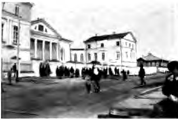
Присутственныя мѣста въ Сольвычегодскѣ

Кромѣ этихъ двухъ храмовъ въ Сольвычегодскѣ обращаетъ на себя внимание очень старинный, какъ говорятъ, домъ, занимаемый нынѣ присутственными мѣстами; по архитектурѣ онъ, конечно, далеко