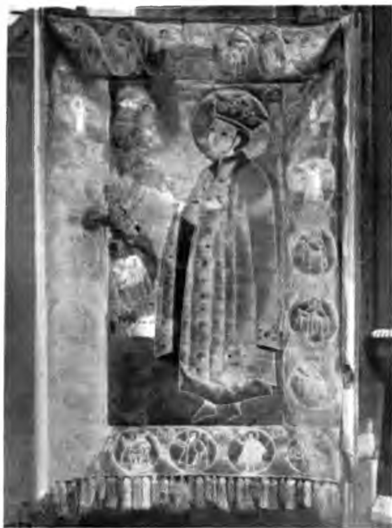
Шитый платъ изъ Солнечегодскаго собора.