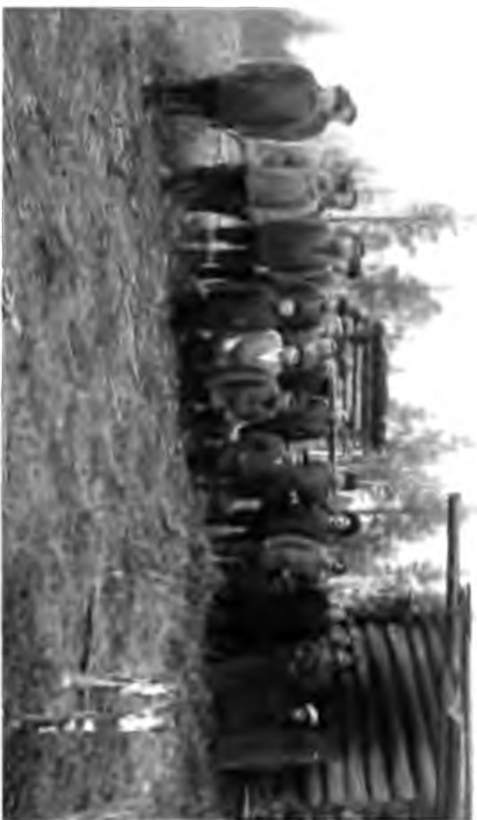
Керка у п. Вуша ко на р. Булепа.