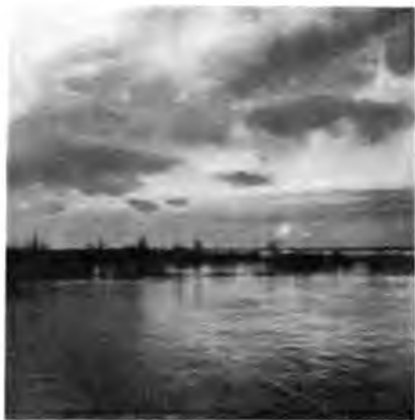
Разливъ при впаденіи Вологды въ Сухону

направленияхъ и, глядя на нихъ, положительно не можешь себя увѣрить, что тамъ течетъ рѣка и что тамъ придется и самому ѣхать; въ солнечную погоду, проходя по здѣшнимъ мѣстамъ, пароходъ такъ изворачивается, что солнце свѣтитъ то справа, то слѣва, то въ лобъ, то въ затылокъ.