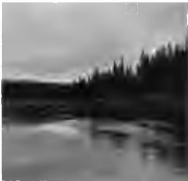
Панорама мѣ и отъ Богородскаго

задерживаемся и, не рѣшаясь въ виду полной неизвѣстности рѣки настаивать, чтобы пароходъ шелъ еще дальше, вскорѣ же, нагрузивъ въ лодки свои запасы и пожитки, начинаемъ свое лодочное путешествіе вверхъ по Вишерѣ.