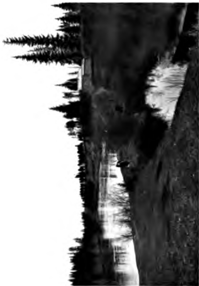
Впадение р. Непб-Юль в р. Ухту.