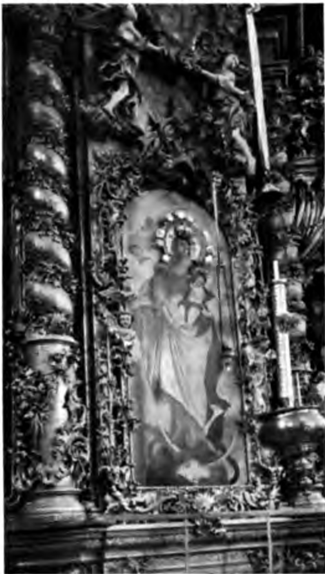
Икона въ Троицк-Гледенскомъ монастырѣ, близъ Устюга.