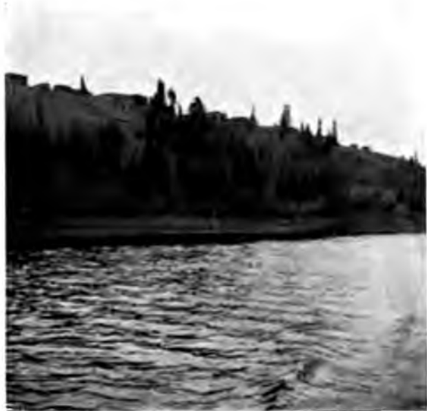
Лѣсникъ Кузблѣ на р. Вычегдѣ.

5 вер. отпускается за 20 коп., а по прошенію по какому-нибудь особому случаю и за 5 коп.; выстроить домъ надо 400 такихъ бревенъ, такъ что эти 400 бревенъ обойдутся всего въ 80 руб. За всѣ сѣнокосы по рѣкѣ они платятъ въ казну аренду, надо сказать, очень умѣренную. Но во всякомъ случаѣ повсемѣстная жалобы на недостатокъ собственной земли, наблюдающееся всюду нежеланіе раздѣлывать лѣса подъ культурную землю, неуверен-