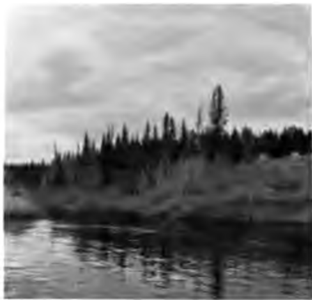
Р. Волью на Вишерѣ

уже совершенно вырубленного, — т. е. лѣсъ-то остался, но все хорошее изъ него уже вырублено, — подъ просвѣчивающимъ сквозь легкя, бѣлыя, прозрачныя облака солнцемъ мы бродили довольно далеко отъ берега Вишеры, лезли по страшному лому въ болотахъ, переходили черезъ ручьи, выходили за болота въ сухой лѣсъ и впервые испытывали ощущение быть въ такомъ мѣстѣ, гдѣ знаешь, что впереди на сотни верстѣ никакого жилья не будетъ и