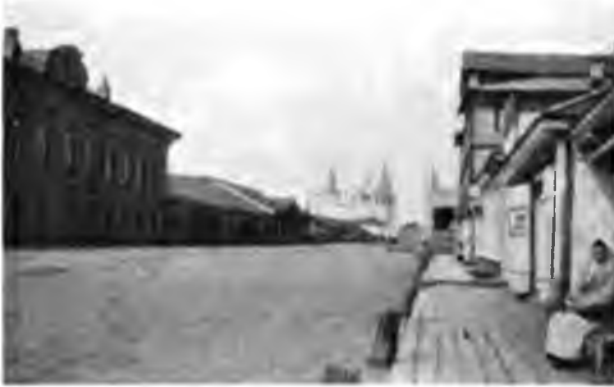
Главная улица въ г. Устюгѣ.

На самомъ берегу возвышается соборъ, въ которомъ покоятся мощи Св. Прокопія и Іоанна, построенный 600 лѣтъ назадъ. На дворѣ собора лежитъ на особой колонкѣ съ надписями камень, перенесенный съ того мѣста въ 16 верстахъ отъ города,