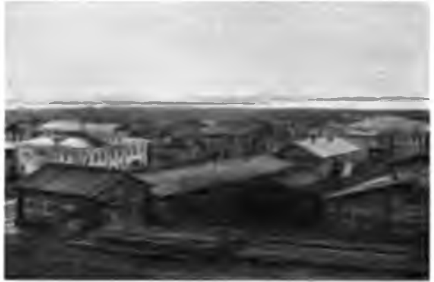
Сліяніе Выма и Вычегды у с. Усть-Вымъ.