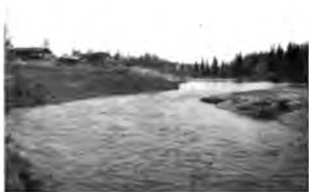
Поселокъ на перевалокѣ на Ухтѣ.

образуя какъ разъ противъ выхода дороги изъ лѣса островъ, сплошь состоящій изъ мелкихъ камней.