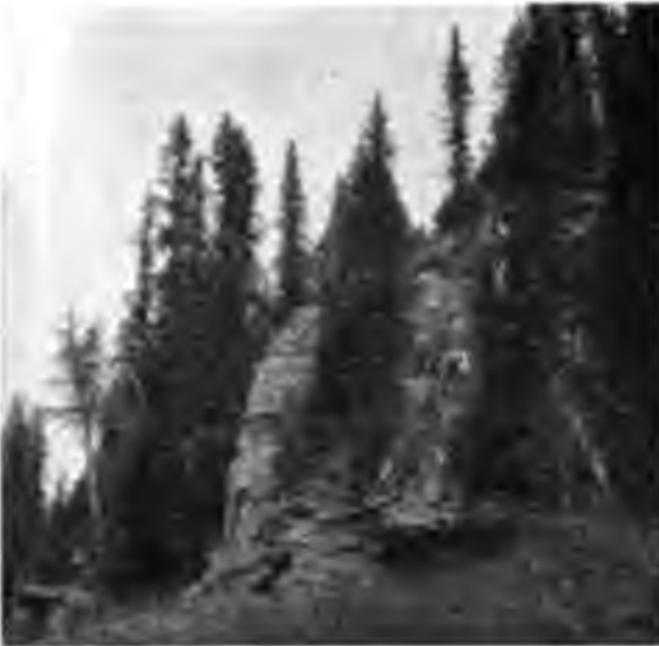
Скалистый берегъ Ухты.

горы немного отступятъ отъ рѣки и оставятъ на берегу низинку, всю заросшую мохнатыми елями, а за ними поднимается сплошь покрытая лиственницею гора. Часто попадаются выходы на берегъ камня, какъ видно съ лодки, известковаго сланца. Ухта въ своемъ теченіи здѣсь перерѣзываетъ Тиманскій хребетъ и имѣетъ характеръ совершенно горной рѣки, со скалами, выходящими на берегахъ, каменистымъ дномъ, поро-