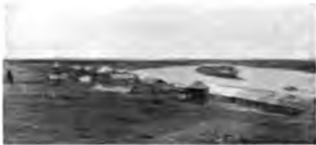
Сереговскій солеваренный заводъ.

По самому берегу растянулся въ обѣ стороны отъ пристани солеваренный заводъ, представлявшій для насъ, никогда на такихъ заводахъ не бывавшихъ, особенный интересъ. Не медля, мы и принимаемся за его подробный осмотръ; онъ производитъ весьма печальное впечатлѣние своимъ разрушеннымъ и заброшеннымъ видомъ, совершенно необъяснимымъ при тѣхъ выгодныхъ условияхъ, въ какія онъ поставленъ. Грязь и гадость вездѣ несомнѣтимыя, постройки старыя, гнилыя, около каждой навалены груды мусора, чрены, въ которыхъ выпариваютъ соль,