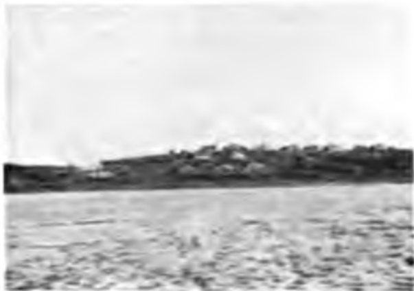
Деревни на Вымѣ

Послѣ долгой дичи и глуши, видна впереди какая-то деревенька, чистенькая, опрятная издали, съ своими приземистыми домами съ бѣлыми окнами, бѣленькой и чистенькой часовней, кругомъ нея воздѣланныя поля, ярко зеленыя на солнцѣ, загородки, покосы съ рядами кольевъ для стоговъ, а тамъ опять та же дичь и глушь, опять лѣса надвинутся