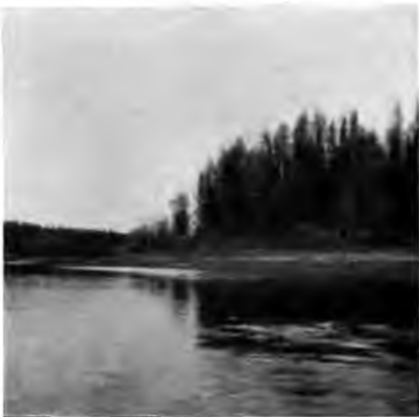
Вымъ въ 75 в отъ Веслянъ

зыряне ведутъ совершенно по особенному: они дѣлятъ всю рѣку на извѣстныя части по названію „чѣмкась“; долго добивались мы, по какому расчету опредѣляютъ они длину своихъ чѣмкасовъ, и, наконецъ, изъ распросовъ и объясненіи поняли, что они рассчитываютъ ихъ не по количеству верстъ, но по тому количеству труда, какое приходится на прохожденіе этой части затрачивать; такъ они говорятъ: „этотъ чѣмкась трудный всего версты въ 3“, а другой легкий и на 8 верстъ рас-