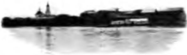
С Устье-Толшевское на р. Сухонѣ.

Южную Мылву съ Иктылемъ и притокъ второй Сѣверную Мылву; рѣки эти допускаютъ вполнѣ судоходство по нимъ, а раздѣлены онѣ волокомъ всего въ 4\frac{1}{2} версты; а затѣмъ изъ Печоры и Илычемъ и Щугоромъ Ухтинская нефть легко могла бы быть подана на самый Уралъ и преобразился бы онъ, застучали бы тамъ машины, свистки выросшихъ заводовъ стали бы будить вѣковую тишину таинственныхъ его лѣсовъ, и серебро, и мѣдь, и другіе металлы широкою рѣкою потекли бы оттуда на рынокъ съ пустующихъ нынѣ изъ-за отсутствия путей сообщенія съ центромъ рудниковъ. Все это есть тамъ, только скрыто это все и нелегко вызвать его на свѣтъ Божій. Попробуемъ.