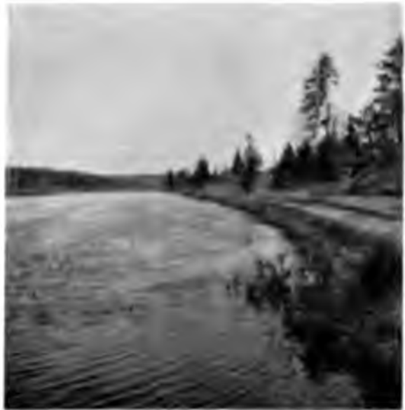
Вишера 30 в. отъ устья.

Рѣка Вишера въ дальнѣйшемъ ее течени за послѣднимъ человѣческимъ жильемъ протекаетъ по совершенно безлюдной мѣстности верстъ болѣе 200, имѣя массу притоковъ съ обѣихъ сторонъ, изрѣзы-