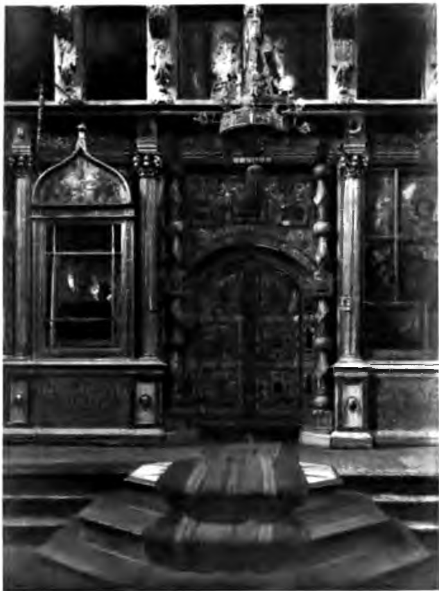
Царския врата въ Сольвычедскомъ соборѣ.