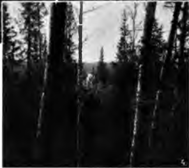
1.—Ухта 2.—Ухта въ 33 в отъ завода. 3.—Ухта съ горнаго берега. 4—Гористый берегъ Ухты.