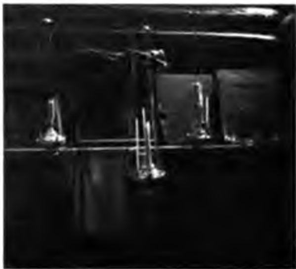
Внутренность зырянской моелельни.

Въ поселкѣ своя моделъня — просто ка- кой-то сарай, въ кото- ромъ внутри повѣшены