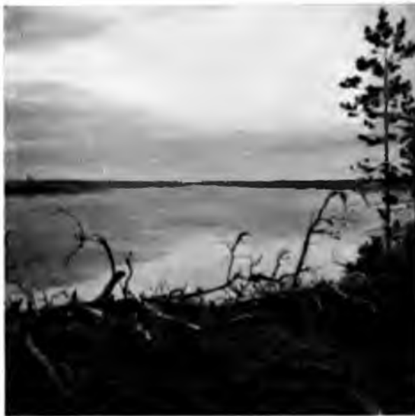
Вычегда за Яренскомъ у с Жешартъ

Верстахъ въ 30-ти за Яренскомъ начинается уже настоящій Зырянскій край; среди лѣсовъ, въ тѣхъ мѣстахъ, гдѣ они, какъ бы разступившись, даютъ пріютъ у себя человѣку, попадаются большія деревни, совершенно отличнаго вида отъ русскихъ; съ перваго же взгляда бросается въ глаза особый типъ постройки: основаніемъ зырянскаго дома является изба на одинъ скатъ съ очень плоской крышей,