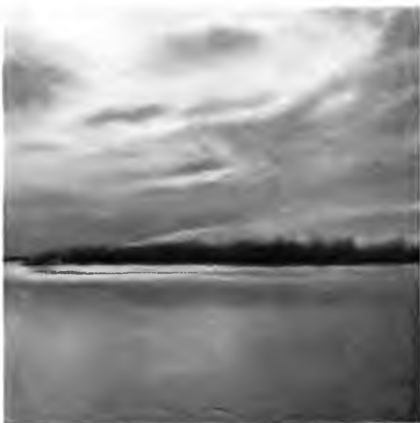
Сліаніе Вологды и Сухоны.

Какъ оказалось, мы ночью часа 4 простояли изъ-за тумана, да еще утромъ брали дрова, такъ что идемъ медленно, чѣмъ рассчитывали, но все-таки мы успѣли за ночь уйти изъ мѣстности населенной и безлюдной и теперь ѣдемъ среди береговъ, покрытыхъ деревьями и селами. Вездѣ видны лѣса, во многихъ мѣстахъ сложены заготовленные дрова. Обиліе лѣса замѣтно и въ постройкахъ—крыши почти всѣ тесовыя. Мѣстность оживленная—много селъ, деревень, на рѣкѣ тоже замѣтна жизнь: оригиналь-