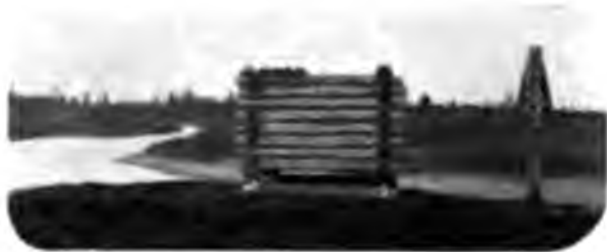
Устье Шомъ Вуквы.