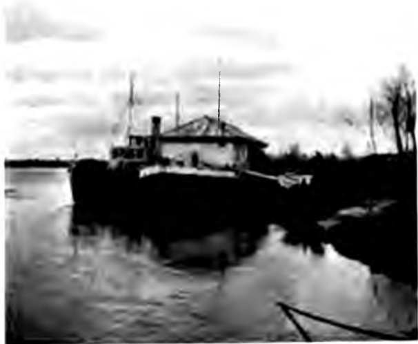
Пристань на Ичегай у г. Яренска

концѣ города на довольно высокомъ мѣстѣ скверъ. За протекающей около города рѣчкой Кижмолою на горкѣ „городокъ“ — часовенка, остатки бывшаго прежде на этомъ мѣстѣ стараго Яренска. Со