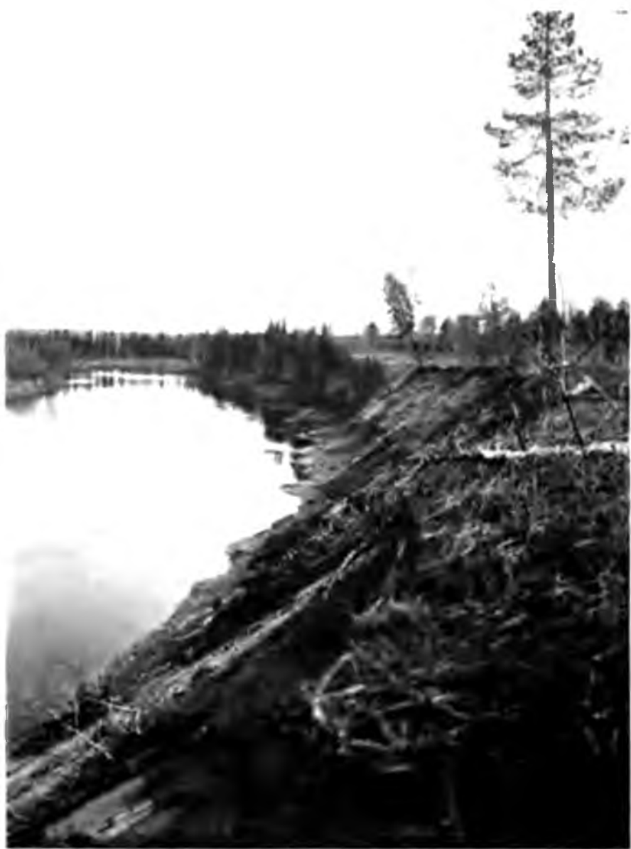
Подмытый берег Ухты у Сидоровской избы.