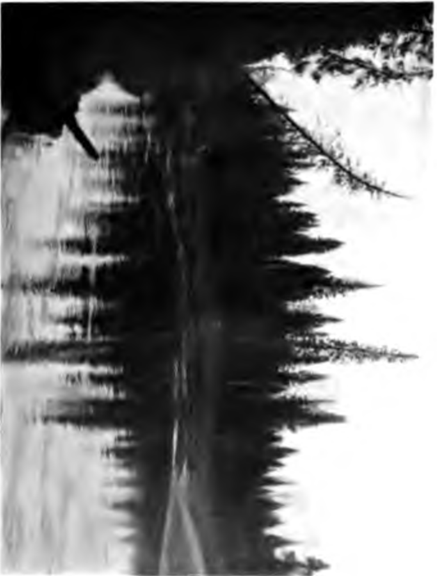
Устье р. Малмечь.