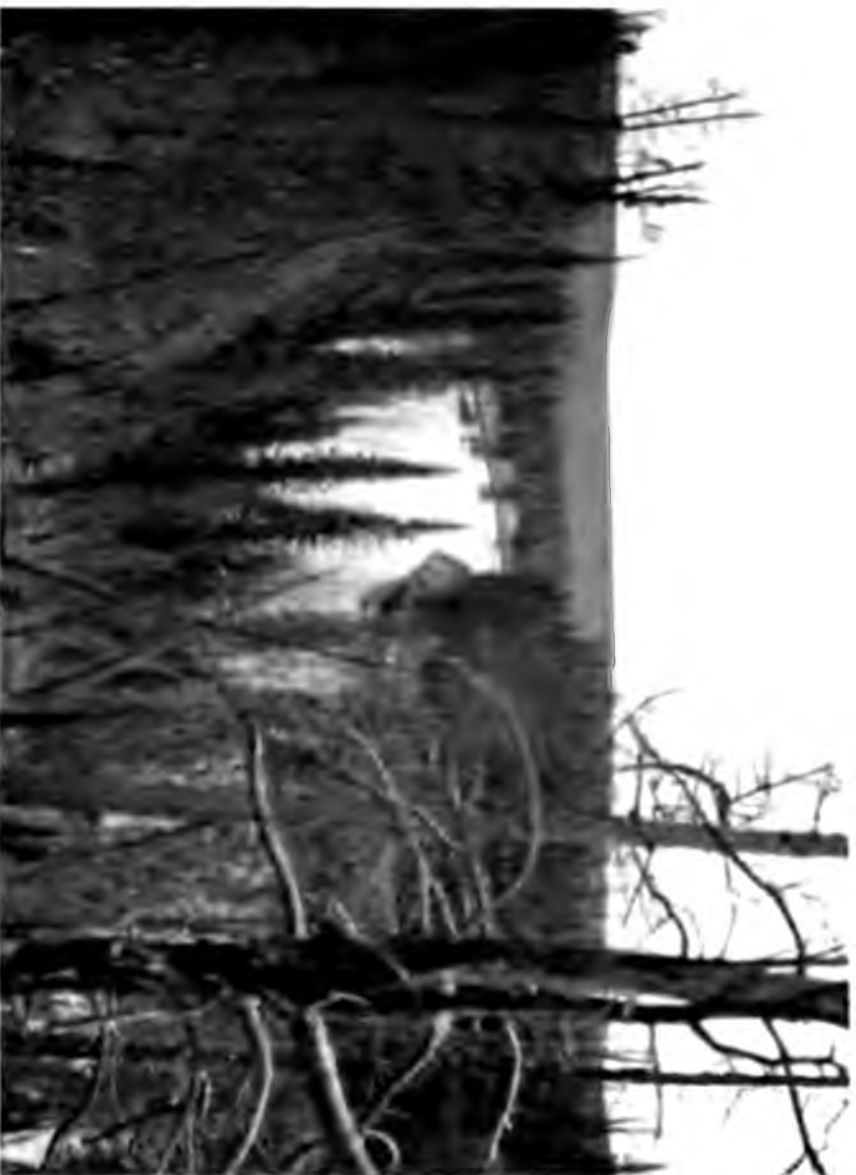
Видъ на Ухту съ бреговата гора.