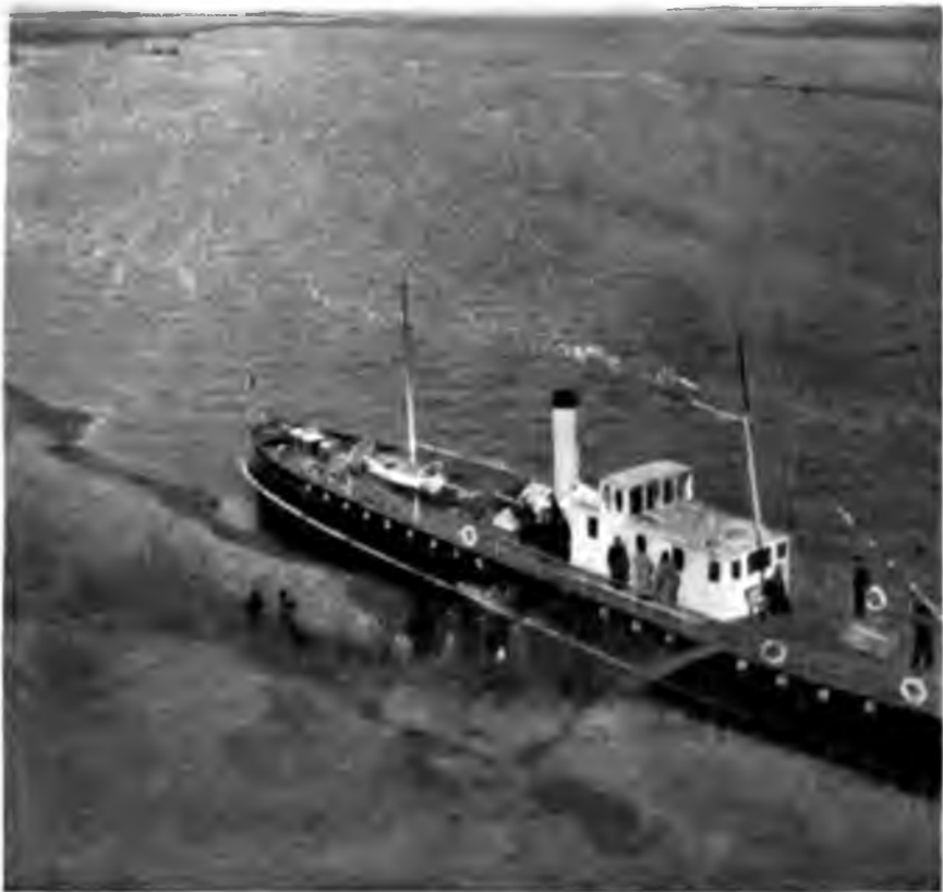
Впадение Юга въ Малую Двину.