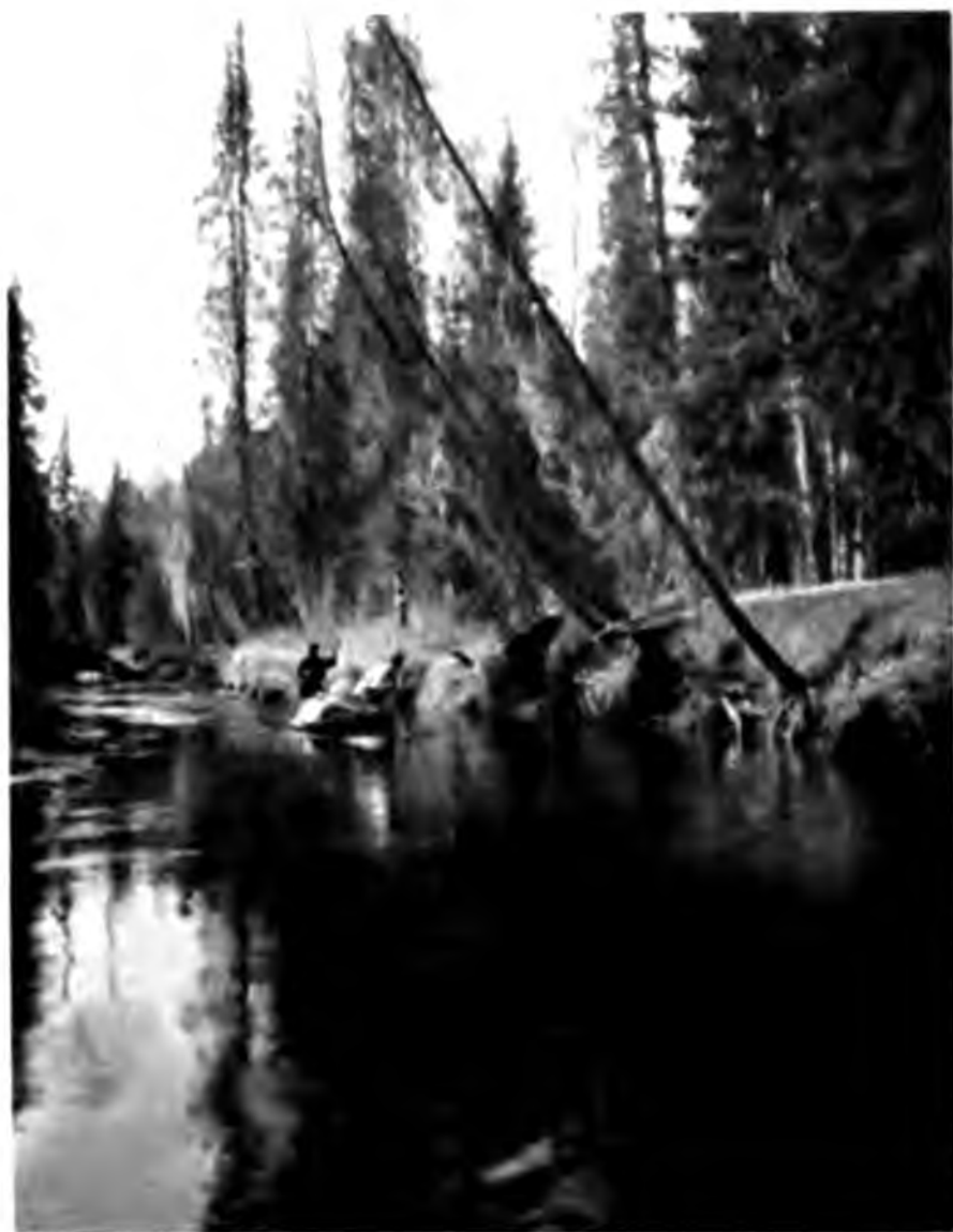
Вукъ-ва на 8 чѣмкаѣ отъ устья.