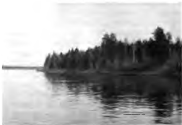
Р. Сухона въ 50 в. передъ Тотьмой.

Не доѣзжая до Тотьмы верстъ 7, красиво вытянулся на Сухонѣ большой длинный „Дѣдовъ островъ“ съ церковью и находящейся на немъ низшею лѣсною школой вѣдомства государственныхъ имуществъ.