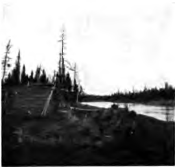
Керка на Вымѣ.

Въ 66 верстахъ отъ Веслянъ (по зырянскому счету) съ праваго берега впадаетъ р. Чись-ва и