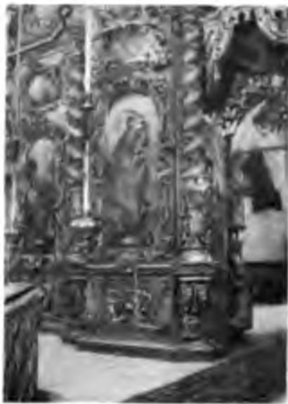
Часть иконостаса и царскихъ вратъ въ Гледенскомъ монастырѣ.

Посѣтили мы и Троицко-Гледенскій монастырь, печально возвышающийся на стрѣлкѣ между Сухоной и Югомъ, брошенный и пустой. Показать намъ монастырь поѣхалъ съ нами монахъ изъ Михаило-Архангельскаго монастыря. Было ясно и страшно вѣтрено; темная вода Сухоны вся кипѣла волнами съ бѣлой пѣной, а когда мы выѣхали на мѣсто слияня ея съ Югомъ, то пароходъ даже стало сильно покачивать; волны сердито набѣгали на него, разбивались о его острый носъ, обдавая брызгами и бока и даже палубу; вѣтеръ дулъ прямо съ Двины, раскинувшейся передъ нами, и гналъ съ нея на насъ все новые и новые валы; изъ безконечной дали зарождались они и большіе и малые, съ ревомъ и шуршашемъ, вырастая, бѣжали намъ навстрѣчу и съ плескомъ разбивались о нашъ пароходъ; вода кипѣла и вся бѣлѣла пѣной. Добрались до берега и то, что изъ Устюга намъ казалось узенькой и низенькой косою съ одиноко возвышающимся на ней монастыремъ, въ дѣйствительности оказалось очень высокимъ берегомъ, на который мы даже должны были взби-