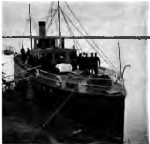
На р. Вычегдѣ

Въ одномъ мѣстѣ очень широкомъ, но, какъ оказалось, очень неглубокомъ, мы, разошедшись полнымъ ходомъ и никакъ не ожидая на этой ширинѣ предательской песчаной банки, со всего-то маху наскочили на мель и плотно на ней стали; глубина оказалась всего въ 1 аршинъ и мель какъ-то такъ ловко облегла насъ кругомъ, что мы никуда выбратъся не можемъ; пробуемъ и задни и передни ходъ, но результатомъ является только взбаломученная вода и ни на одинъ вер-