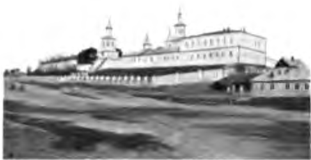
Женскій монастырь въ Устюгѣ.

Въ Устюгѣ 11.000 жителей, а въ его уѣздѣ 136.000 на 14.912 кв. верстахъ общей площади уѣзда, но население осѣло преимущественно въ его южной