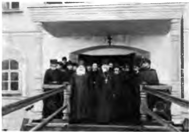
Братія Ульяновскаго монастыря.

лужи, показывая различную рѣзвость, во всѣ лопатки задувала монастырская молодежь, изъ любопытства, пренебрегши дождемъ, пришедшая на пристань. Такъ везомые въ экипажахъ и сопровождаемые бѣгущими по сторонамъ длинными черными фигурами и вкатили мы въ монастырскія ворота. Монастырь этотъ очень богатый и очень многолюдный, благодаря этому мечтающій, пока все, быть ставропигиальнымъ; брати въ немъ настоящей до 80, а всѣхъ съ послушниками, годовиками и т. п. до 200. Зданія всѣ каменныя, крѣпкія, храмы бо-