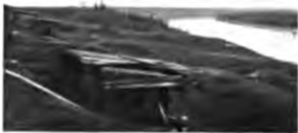
Видъ на р. Вымѣ изъ д. Козлова.