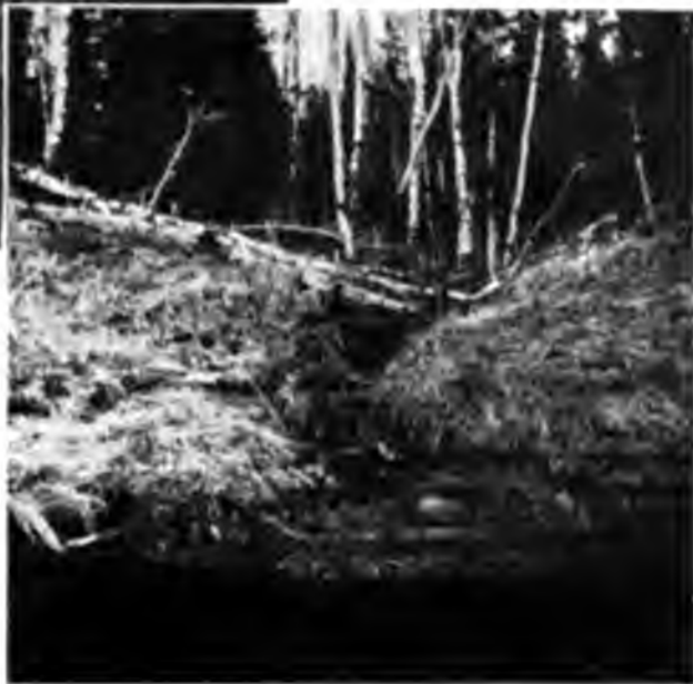
Выходъ нефти на Ухтѣ.

въ рѣчку, а по ней все время то тоненькими струйками, то сплошными жирными черными пятнами плыветъ нефть. Опущенный въ трубу лотъ показалъ глубину въ 14 саж., діаметръ трубы 4 дюйма. Пробовали мы и жечь нефть, и она горѣла у насъ, треща, коптя и испуская характерный смрадъ горящаго керосина.