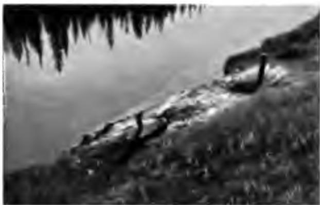
Вышка нефти на Ухтѣ

Проѣхали еще мимо одной трубы и, наконецъ, къ вечеру уже подъѣзжаемъ къ Сидоровской избѣ; на высококомъ правомъ берегу видны нѣсколько строени довольно большого размѣра, а немного подалѣе виденъ пониже небольшой домикъ—казенная изба для остановки лѣсныхъ чиновъ. Верстахъ въ полутора или двухъ изъ-за лѣса видна вышка