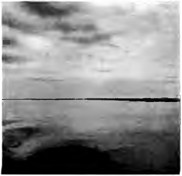
Лаина у с. Аристова.

опять въ жизнь большихъ городовъ на желѣзныхъ дорогахъ, отъ которой мы уже начали отвыкать, проѣхавъ столько времени на парохдѣ по спокойной, отошедшей отъ всякихъ рельсовыхъ путей рѣкѣ. Невольно приходитъ въ голову мысль о причинахъ проведенія желѣзной дороги сюда на Котласъ, а не на находящійся всего въ 60 верстахъ отсюда большой оживленный, центральный городъ, и положительно не можешь объяснить себѣ, почему это такъ вышло. Вѣроятно, соображенія, по которымъ понадобилось возвысить небольшое село и обойти крупный торговый центръ, принадлежатъ къ разряду недоступныхъ обыкновеннымъ смертнымъ; они не поймутъ ихъ, какъ не могутъ понять, почему желѣзная дорога отъ Вологды на Архангельскъ проведена сплошной пустыней, почему Вятская дорога, идя нѣсколько верстъ отъ Вологды по тож-