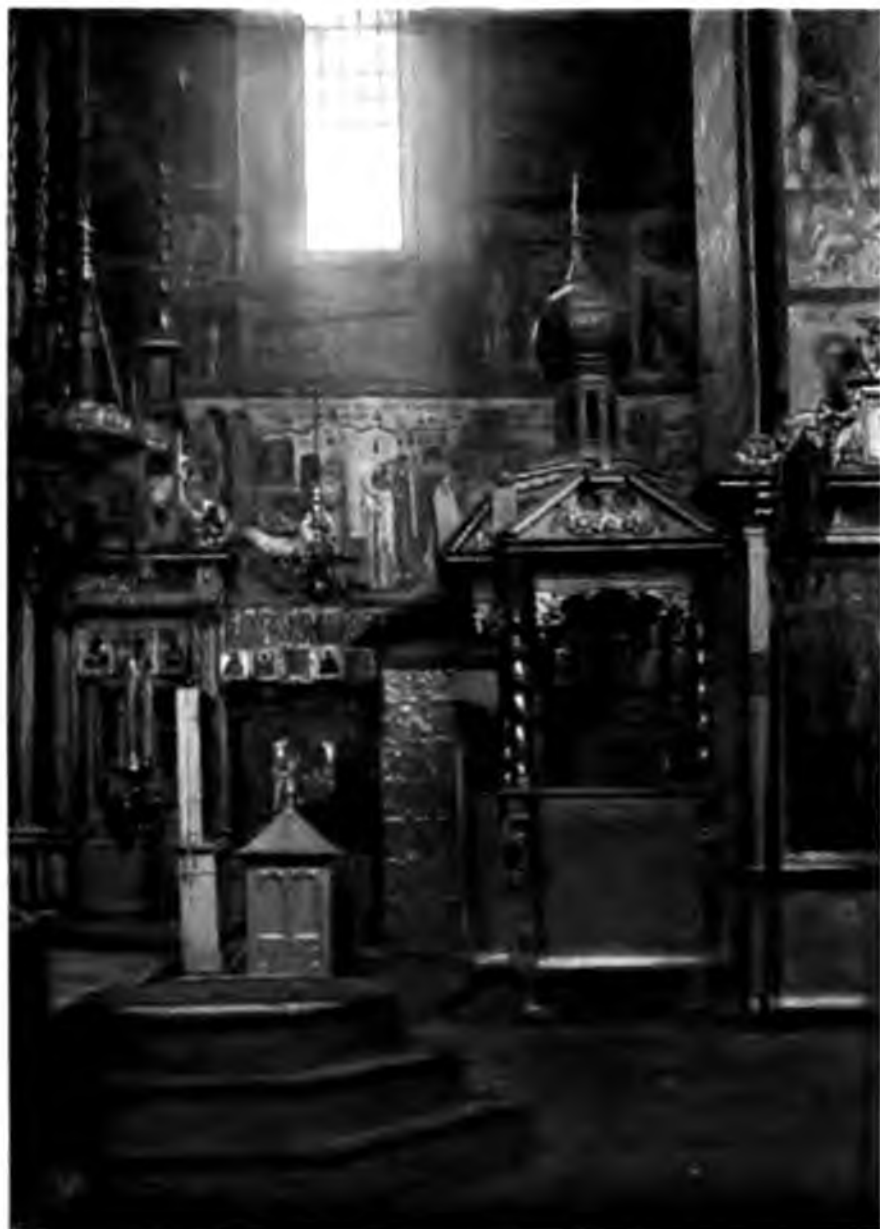
Благовѣщенскій соборъ въ Сольвычегодскѣ.