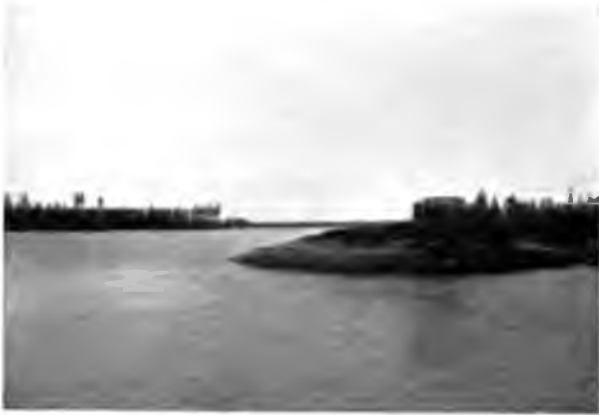
Старая Вычегда и коровьи дачи.

нечнаго лѣса; на горахъ, видно въ бинокль, растеть сосновый боръ съ бѣлымъ мхомъ. Чѣмъ ближе къ городу, тѣмъ селенія все чаще; иногда линия ихъ прерывается и лѣсъ подходитъ къ самой рѣкѣ и опять по берегу потянется ломъ и оборвавшіяся въ воду деревья, а тамъ опять, глядишь, зазеленѣютъ озимыя поля и запестрѣютъ деревушки. На рѣкѣ много песчаныхъ острововъ, иногда заросшихъ кустами ивы, какъ щетиной, иногда совершенно голыхъ. На низкомъ