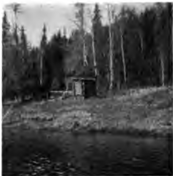
Керка на Ухтѣ

За Тобысемъ Ухта дѣлается сразу вдвое уже. На ней очень много пороговъ и малыхъ и большихъ и все время, пока мы поднимаемся по ней до самаго перелока, они попадаютъ то въ видѣ просто быстрины, то въ видѣ большихъ пространствъ воды — кипящихъ и клокочущихъ; иные короткіе, а иные очень длинны, напр., порогъ „Сизимъ-русь-косъ“ (семидырный) тянется на нѣсколько сотъ сажень. Название ему дано такое оттого, что въ этомъ мѣстѣ Ухта образуетъ очень много острововъ изъ на-носнаго песка и камней,