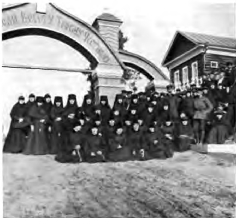
Братья Кылтовскаго монастыря.

работа была уже доведена до концовъ оконъ нижняго ряда. Зданiя въ монастырѣ очень много и для келiй и для разнообразныхъ мастерскихъ; есть тутъ и иконописная, и сапожная и вышивальная, произведениями которой мы любили въ ризницѣ. Всюду, куда ни заглядывали, начиная отъ помѣщенiя настоятельницы и кончая кухней, мы