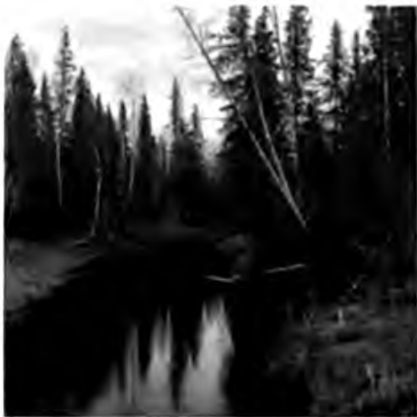
Вуква въ 60 в. отъ устья.

Съ праваго берега вливается рѣчка Мадмась, довольно широкая при впадении и, какъ говорятъ зыряне, очень длинная, по крайней мѣрѣ лѣсъ весною гонягъ по ней цѣлые 7 дней, а за нимъ Вуква опять течетъ по еловому лѣсу, дѣлаясь все уже и извилистѣе. На берегахъ навалено безъ конца деревьевъ, принесенныхъ весенней водой, ломъ ужаснѣйшій, и среди этого лома и перепутавшихся между собой во всевозможныхъ положеніяхъ корягъ и стволовъ извивается Вуква, поворачивая то туда, то сюда, ни разу не образуя хотя бы не особенно длиннаго плеса. И чѣмъ дальше, тѣмъ Вуква становится уже, лома на берегахъ все больше. То она идетъ лѣсомъ и тотъ нависнетъ