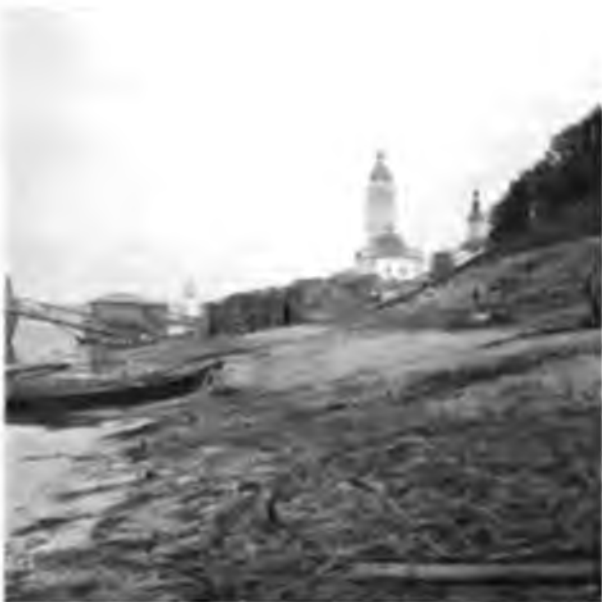
Тотьма въ 12 ч. ночи.

О ремесленномъ училищѣ стоитъ сказать нѣсколько словъ: училище это устроено, оборудовано и поддерживается на средства уроженца Тотьмы г. Токарева; цѣль его съ одной стороны дать возможность крестьянскимъ мальчикамъ и дѣвочкамъ изучить какое-нибудь ремесло и